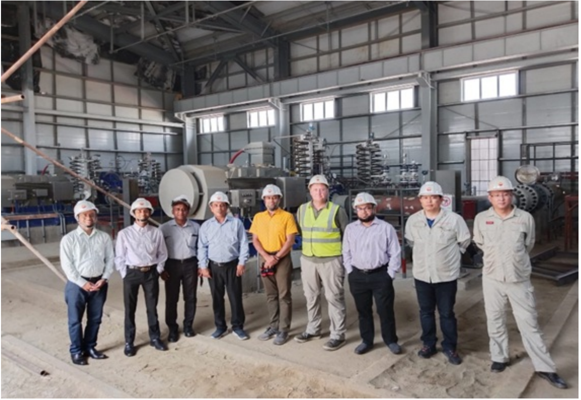
চিত্র ০১. মহেশখালিতে এসপিএম প্রকল্পে নির্মিত ক্রুড ওয়েল ও ডিজেল পাম্প স্টেশন