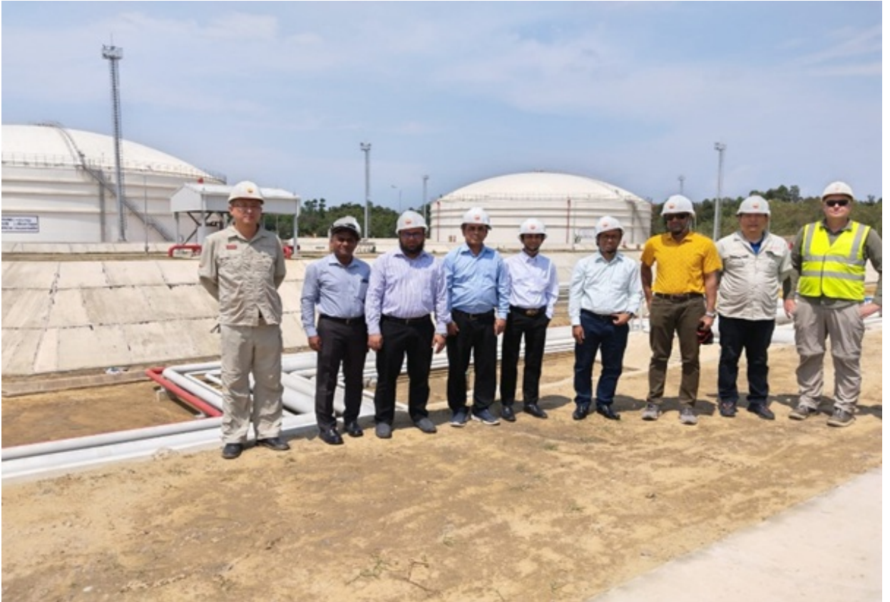
চিত্র ০২. মহেশখালিতে এসপিএম প্রকল্পে নির্মিত ৩৬ হাজার ঘন মিঃ ধারণক্ষমতা সম্পন্ন এইচএসডি ডিজেল স্টোরেজ ট্যাংক