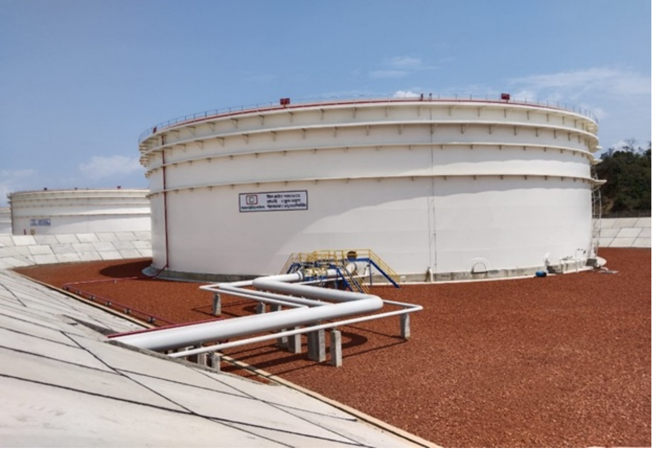
চিত্র ০৩. মহেশখালিতে এসপিএম প্রকল্পে নির্মিত ৬০ হাজার ঘন মিঃ ধারণক্ষমতা সম্পন্ন ক্রুড ওয়েল স্টোরেজ ট্যাংক

৪। মহেশখালি ও চট্টগ্রামে এসপিএম প্রকল্পের ইমার্জেন্সি প্রবেশ পথ সংলগ্ন ২ কি. মি. গ্যাস পাইপলাইন স্থাপনের কাজ চলমান রয়েছে। মহেশখালি-খলঘাটা, চট্টগ্রাম-গহিরা-ও-ডাঙ্গারচরে মোট তিনটি ব্লক ভালভ স্টেশনের নির্মাণ কাজের ৪.১% বাকি রয়েছে। তাছাড়া, চট্টগ্রাম বাঁশখালিতে একটি মাইক্রোয়েভ রিলে নির্মাণাধীন টাওয়ারের ৫% কাজ অসম্পন্ন রয়েছে। সরেজমিনে পরিদর্শন, প্রেজেন্টেশন, প্রকল্প পরিচালকসহ সংশ্লিষ্টদের সাথে মত বিনিময়ে ৯৫% ভৌত কাঠামো নির্মাণের অগ্রগতি হয়েছে মর্মে জানা যায়।